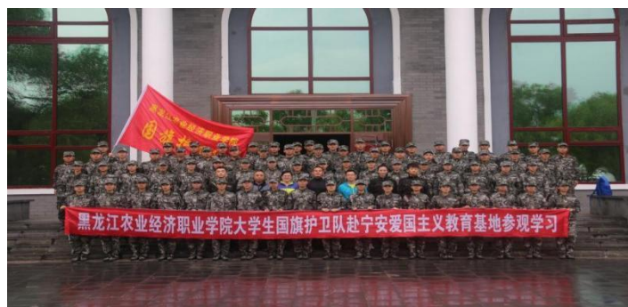
图 12 大学生国旗护卫队赴宁安进行爱国主义教育

学院不懈推进“军魂铸校魂”, 切实加强军事教育工作, 强健学生意志体魄, 增强学生爱国情感。成立由退役士兵组成的大学生国旗护卫队和青年教官团, 依托军事化管理平台, 通过军事化训练、大型活动国旗护卫、社会实践服务、爱国主义教育、宣讲国旗知识、热心社会公益等途径, 团队成员以出色的军事素养和优秀的军人品质, 发挥榜样引领作用和辐射带动效应, 组织早军操、晚内务和军事训练等活动, 有效推进绿色军营文化进校园, 推动军事训练成果应用转化, 带动增强了学生的责任意识、团队意识、纪律意识, 近三年累计征兵人数 800 余人, 形成同圆“强国梦”、共筑“强军梦”的良好氛围。