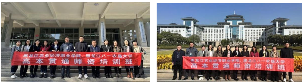
图 1 与黑龙江八一农垦大学联合开展高本贯通师资能力提升专题培训

本年度，学院继续与黑龙江八一农垦大学在作物生产与经营管理、现代农业经济管理、畜牧兽医三个专业合作开展“高本贯通”人才培养，2023年度实现招生180人，在校高本贯通人才总数540人。创新了多方协作高效联动“高本贯通”人才培养机制，联手黑龙江八一农垦大学、大北农集团、百果园实业等单位，在“共同投入、共同建设、共同管理，互享资源、互享人才、互享成果”的校企协同育人理念下开展深度合作，打造了基于“平台+模块”的高本贯通“3+2”分段培养立体化贯通课程体系；强化“高本贯通”师资队伍建设，配备博士学位及高级职称教师队伍承担教学任务；完善“高本贯通”人才培养保障条件，打造涉农人才培养的“立交桥”。