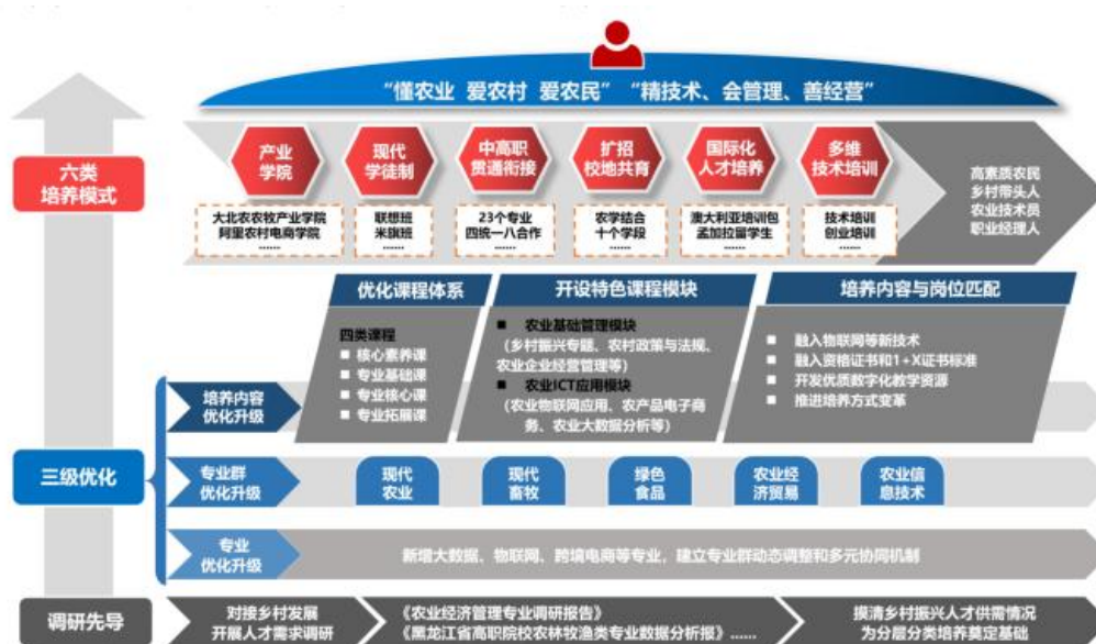
图 17 “三级优化六类培养”农学结合、育训并重人才供给模式

与农业产业链条相关方协同育人，建立大北农现代农牧、阿里农村电商等 4 个产业学院、33 个学徒制班，实施产业学院、学徒制等六类培养模式，与地方组织部联合招生、共管共育，与农业企业开展订单培养和学徒培养，实行分层分类培养，破解人才供需脱节问题，强化课程思政，注重情怀培育，培养了大批高素质农民、乡村带头人、农业技术人员和农业经理人等乡村人才。