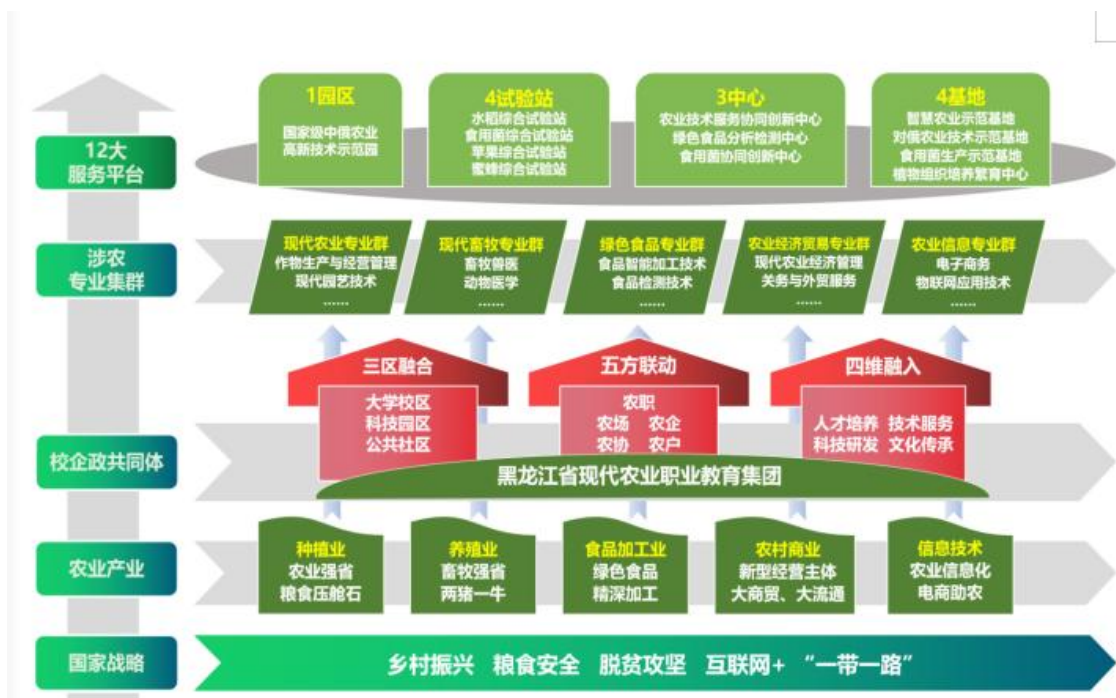
图 16 “三区融合五方联动四维融入”校企政协同发展共同体