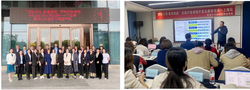
图 2 在线开放课程开发及建设培训