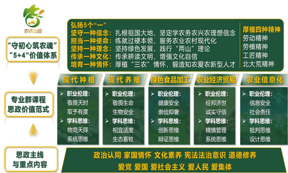
图3 “守初心筑农魂”“5+4”价值体系

在共有价值体系引领下，将“敬畏天时、经纶济世”等职业伦理和“物竞天择、精慎管理”等学科思维融入课程。通过价值引领、文化浸润、师风引导，将价值体系根植于学生心田，锻造学生奉献农业农村的价值观。