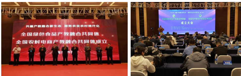
图 10 全国绿色食品、农村电商产教融合共同体成立大会

为深入贯彻落实中共中央办公厅、国务院办公厅《关于深化现代职业教育体系建设改革的意见》及《教育部办公厅关于加快推进现代职业教育体系建设改革重点任务的通知》（教职成厅函〔2023〕20号）等文件要求，在教育部职业教育与成人教育司、黑龙江省教育厅等指导下，2023年11月，黑龙江农业经济职业学院牵头与中化现代农业（黑龙江）有限公司、黑龙江八一农垦大学成立全国绿色食品产教融合共同体；与浙江淘宝教育科技有限公司、哈尔滨商业大学成立全国农村电商产教融合共同体，来自全国20余个省市的企业、院校、行业学会协会和科研机构的共同体成员单位代表和专家近200人齐聚中国雪城—牡丹江，共商绿色食品和农村电商产教融合发展大计。学院以两个共同体为契机，按照现代职业教育体系建设的新要求，抢抓国家进一步推动新时代东北全面振兴取得新突破的新机遇，把握住《教育部 黑龙江省人民政府推进职业教育与产业集群集聚融合服务龙江振兴发展实施方案》的新契机，深入落实好党的二十大提出的职普融通、产教融合、科教融汇新精神，主动担责、主动融入、主动升级，为国家战略粮仓、农业强国建设和乡村全面振兴提供更好的人才保障、智力支持和技术支撑。