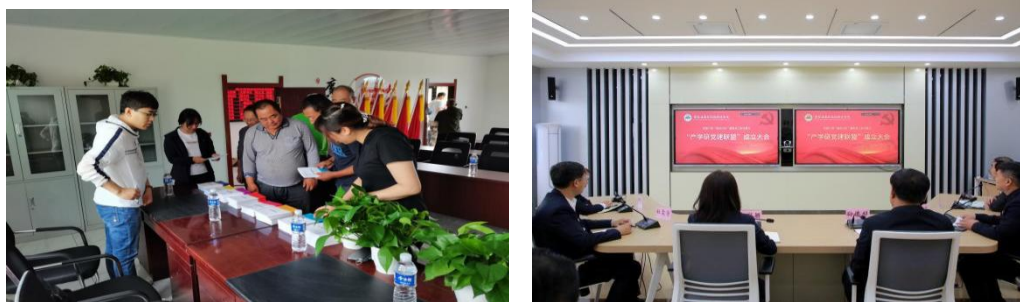
图 19 “产学研党建联盟”试点院校