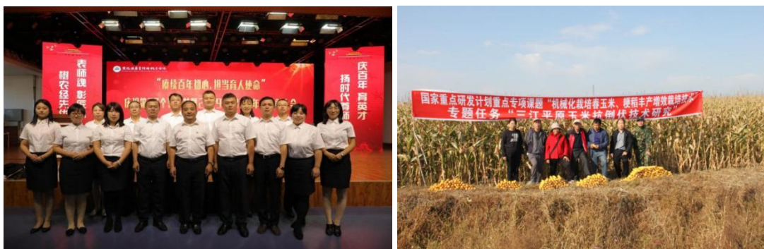
图 18 全国高校黄大年式教师团队

2018 年以来，作物生产与经营管理专业团队以践行“心有大我，至诚报国”黄大年精神为初心，秉持“立足乡村办学、倾心农职教育、零距离服务三农”办学理念，立足区域资源优势，聚焦产业瓶颈问题，携手中国科学院东北地理所、黑龙江省农科院牡丹江分院等单位协同开展技术攻关，共建国家级协同创新中心 3 个，立项省级自然科学基金项目 3 项，合作培育农作物新品种 46 个，推广新技术 14 项，授权专利 10 项，广泛开展农业技术培训，年培训新型职业农民、家庭农场主等 5000 余人次，开展各类科普服务 50 余万人次，创新了“一核多维三课堂”“三农”服务新模式，服务龙江大粮仓案例入选世界职教发展大会“典型案例”，团队 2022 年获批全国高校黄大年式教师团队。