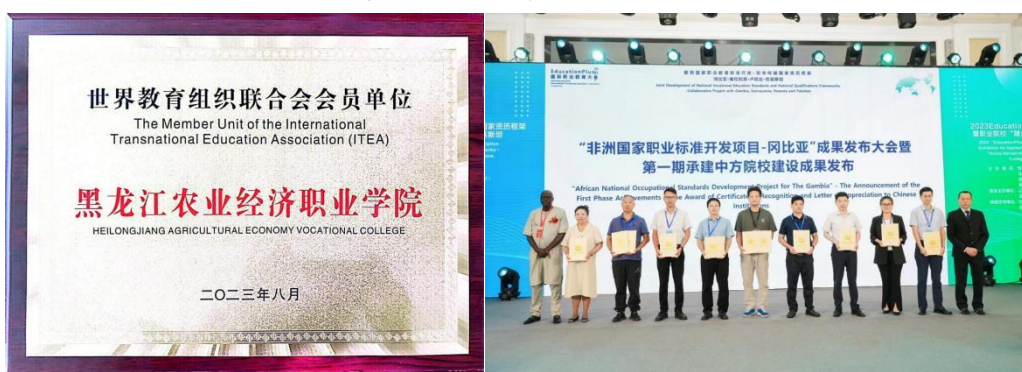
图 14 世界教育组织联合会

学院入选 ITEA（世界教育组织联合会）联盟成员单位，承接 4 项非洲冈比亚国家职业标准建设任务，组建校企合作开发团队，对接冈比亚国家资历框架开发要求，高质量完成了项目开发工作。《智能物流技术员 NTA4》《物流管理技术员 NTA6》《食品检验检测技术员 NTA4》《畜牧兽医技术员 NTA5》4 项非洲冈比亚国家职业标准，得到冈比亚教育部高度认可，顺利通过认证，并在 2023 EducationPlus 国际职业教育大会上获得了感谢信。