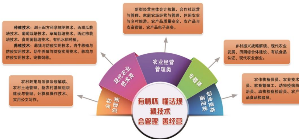
图 4 五位一体复合型课程体系图