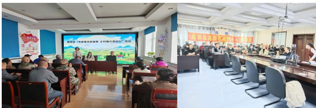
图 7 杨念福教授赴嘉荫县驻县援边