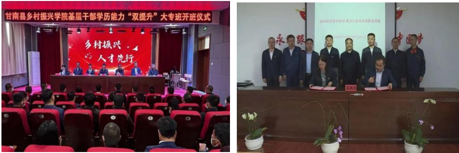
图 9 科技特派员下基层服务