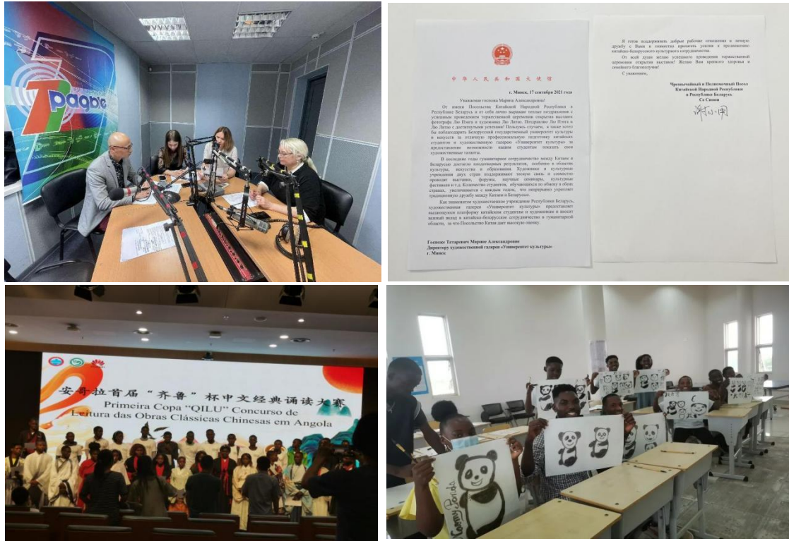
图 15 对外文化交流