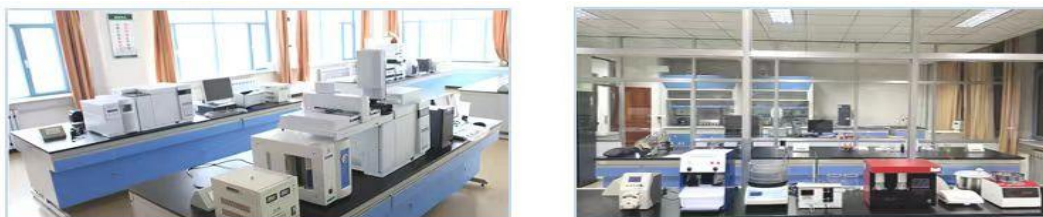
图 6 检验检测中心检验室

黑龙江农业经济职业学院检验检测中心成立于 2007 年, 同年被黑龙江省科技厅授予寒地果树省级重点实验室。2014 年与宁安质量技术监督局合作认定为黑龙江省果蔬、烟草检验检测分中心, 2019 年获批绿色食品分析检验国家级应用技术协同创新中心, 2023 年中心通过检验检测机构资质认定(中国计量认证 CMA)。中心立足于服务国家粮食安全战略和黑龙江省农业高质量发展, 面向农业生产企业、食品加工企业、科研单位, 开展食品、农产品生产环境检测、产品品质分析、重金属、农(兽)药残留、添加剂、污染物和微生物含量测定等检测服务。经黑龙江省市场监督管理局批准, 可出具食品与环境领域 366 个检验参数、152 个产品的检测报告。近五年累计服务 40 余个单位和企业, 检测样次 4600 余个, 培训员工 500 余人, 完成自然基金和联合科技攻关项目 10 余个。中心已成为区域内企业和科研院所检测技术服务中心、设备共享中心和检测技能培训中心。