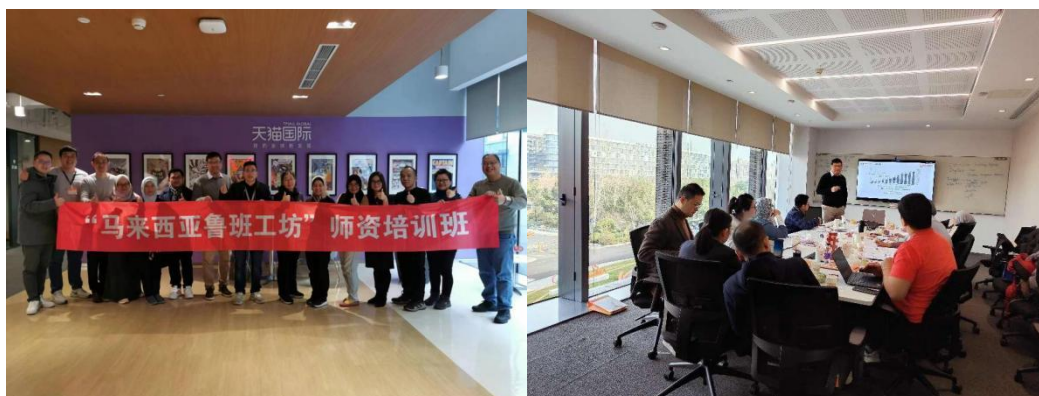
图 13 马来西亚开物工坊培训班

学习到了更多的先进技术技能，提升了自身专业能力，为推动开物工坊可持续发展提供了有力的技术技能支撑。